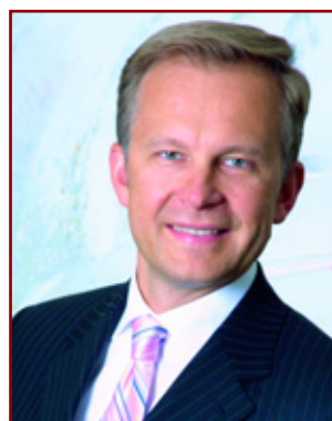
ILMĀRS RIMŠĒVIČS Latvijas Bankas prezidents

* Plašāku informatīvo materiālu klāstu par SVF lasiet Latvijas Bankas mājas lapā www.bank.lv