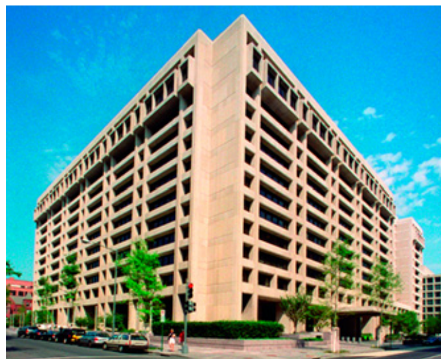
Starptautiskā Valūtas fonda galvenā ēka Vašingtonā, ASV.