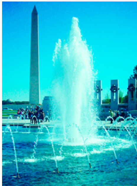
Nacionālais Otrā pasaules kara memoriāls Vašingtonā.

Svarīgs virziens – izstrādāt tālāko SVF stratēģiju. Fonda galvenais uzdevums ir veicināt globālo finanšu stabilitāti. Tāda bija galvenā Bretonvudas vīzija pirms 60 gadiem, un šis uzdevums ir aktuāls arī šobrīd. Tomēr ekonomiskā vide kļuvusi komplicētāka, integrētāka, līdz ar to fonds uzmanību vairāk centrē uz sistēmiskiem jautājumiem. Attīstītas valstis, kurām tagad ir peldošie valūtas kursa režīmi un brīva pieeja privātajiem kapitāla tirgiem, vairs neaizņem no SVF un līdz ar to ir mazāk atkarīgas no tā ieteikumiem. Fonda kreditēšanas raksturs ir mainījies. Bretonvudas laikā, kad pastāvēja fiksēto valūtas kursu sistēma, SVF izsniedza īstermiņa aizdevumus īstermiņa maksājumu bilances problēmu risināšanai. Savukārt,