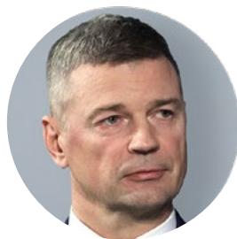
Mārtiņš Bitāns Latvijas Bankas Monetārās politikas pārvaldes vadītāja vietnieks